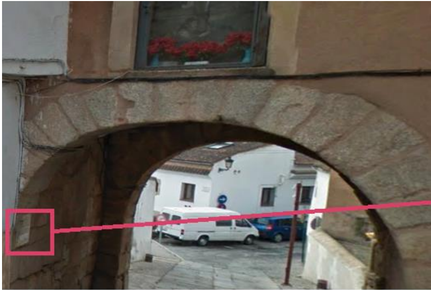
"Arco del Cristo"

Respuestas válidas: Arco del Cristo / Puerta del Río / del Cristo