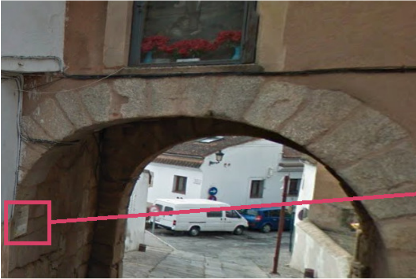
"Arco del Cristo"